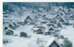
白川郷・五箇山の合掌造り集落