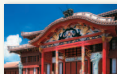
琉球王国のグスク及び関連遺産群