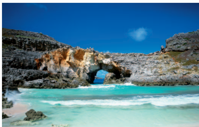
小笠原諸島 2011年に世界自然遺産として登録された南島は、その支那系の景観、多くの固有の種に加え、アジア植物の集まりが揃っていること、幅広い種類の樹木が生い茂っていることなどから、絶大な価値を認められています。