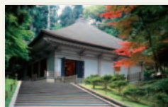
平泉—仏国土(浄土)を表す建築・庭園及び考古学的遺跡群—